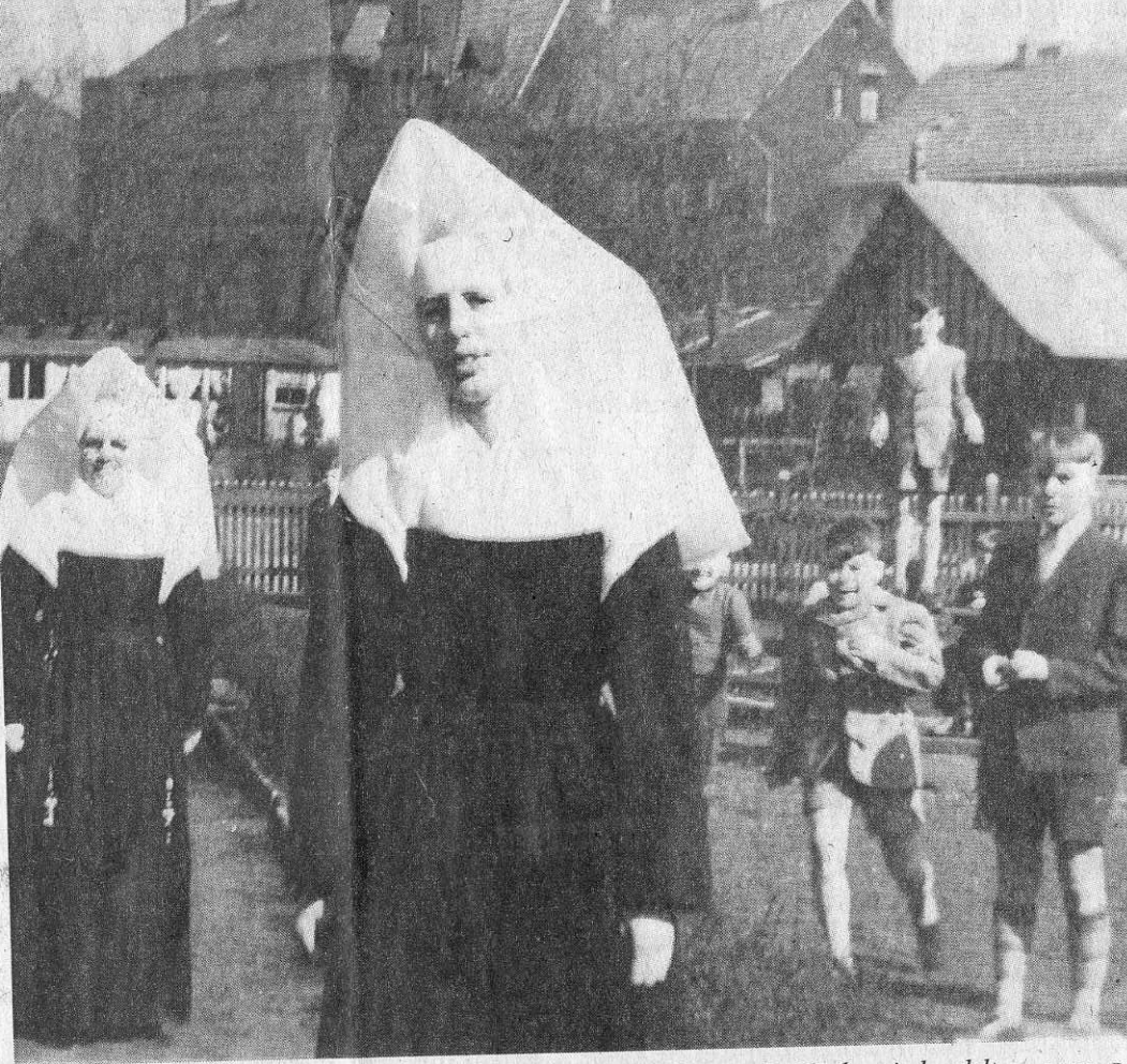
Schwestern des Vincenzheims in Dortmund mit Zöglingen. Auch dort wurden Kinder misshandelt.