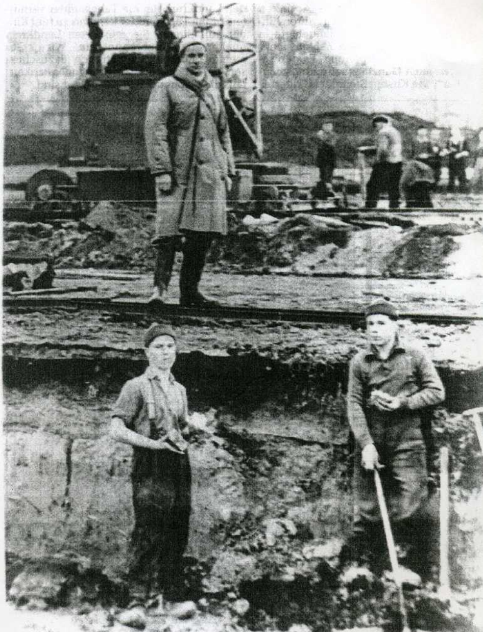
Tausende von Jugendlichen mussten jahrelang im Moor rund um Freistatt schuften. Das Bild von der Frühstückspause entstand vor etwa 40 bis 50 Jahren.